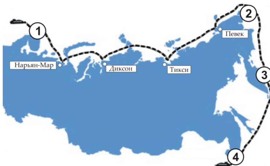
Рисунок 2. Морская трасса

реки Сибири, позволяют ввозить оборудование, топливо, продовольствие и вывозить лес и природные ископаемые. Как называется этот путь? Рассмотрите рисунок и ответьте на дополнительные вопросы.